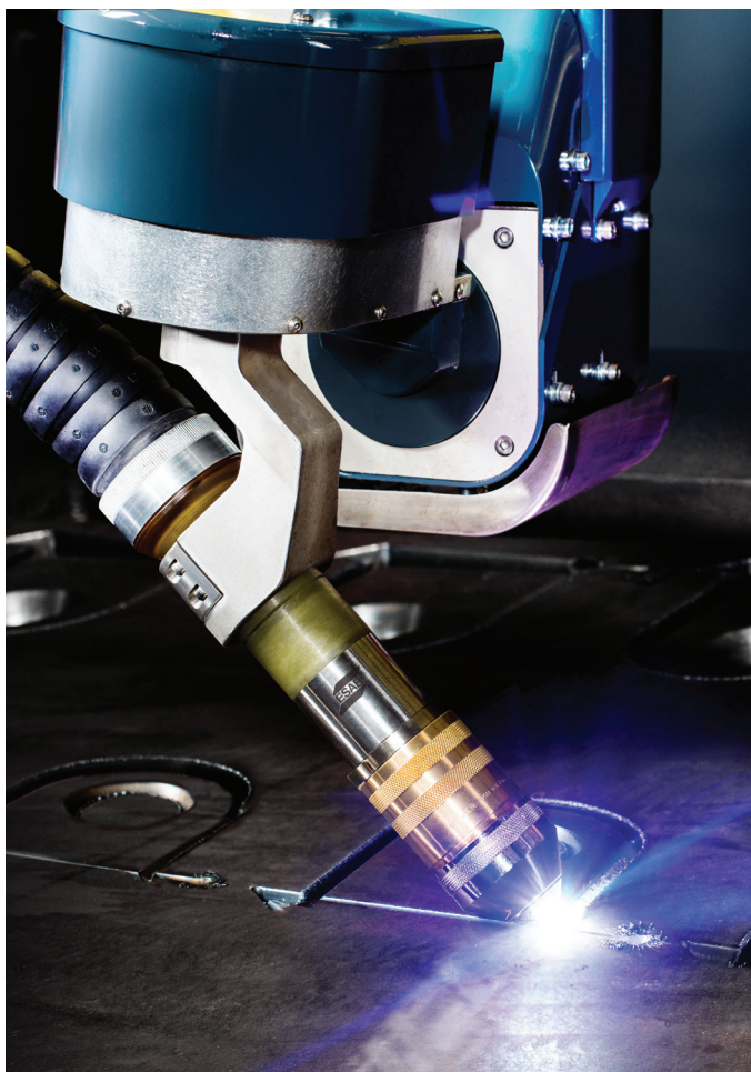
Автоматический блок резки фаски DMX