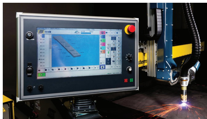
Технология SmartBevel позволяет оператору упростить выполнение резки под углом

Производство деталей с фасками высокого качества с DMX