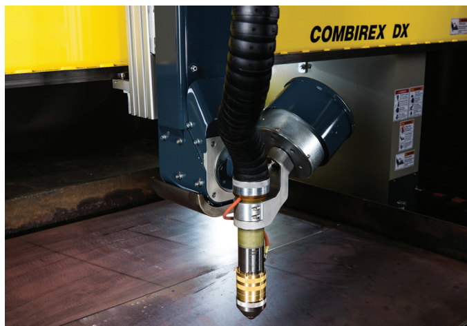
DMX можно применять на машинах класса Combirex DX и выше

DMX – это надежная плазменная система резки фаски благодаря эксклюзивной системе прямого перемещения по нескольким осям от ESAB. В ней используется меньше компонентов в целях повышения надежности и сокращения обслуживания. Система совместного перемещения с многоточечной противоударной защитой Multi-Point Collision Protection автоматически приходит в исходное положение после столкновения и не требует стандартной регулировки.